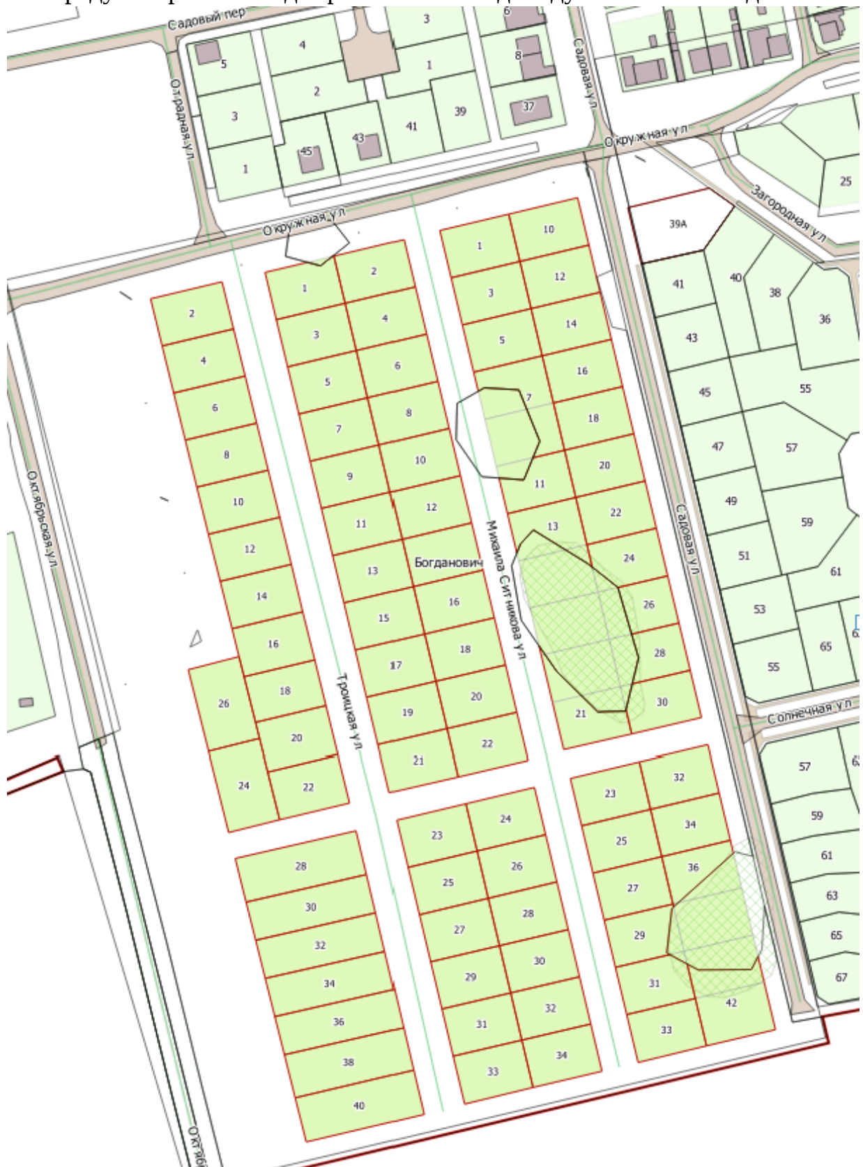
СХЕМА МЕСТОПОЛОЖЕНИЯ ЗЕМЕЛЬНЫХ УЧАСТКОВ, предусмотренных под строительство индивидуальных жилых домов