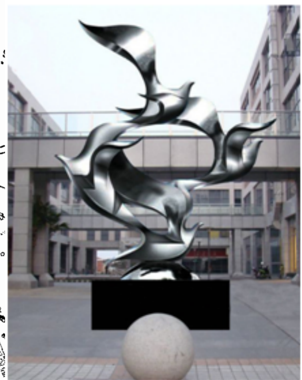
Скульптурная композиция "Голубь мира"