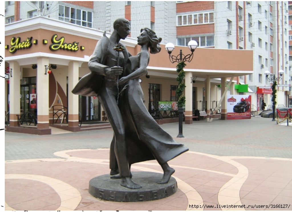
Скульптура "Танцующая пара"