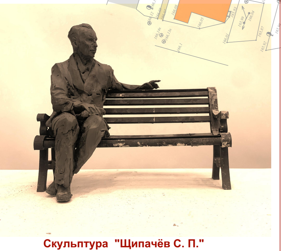
Скульптура "Щипачёв С. П."