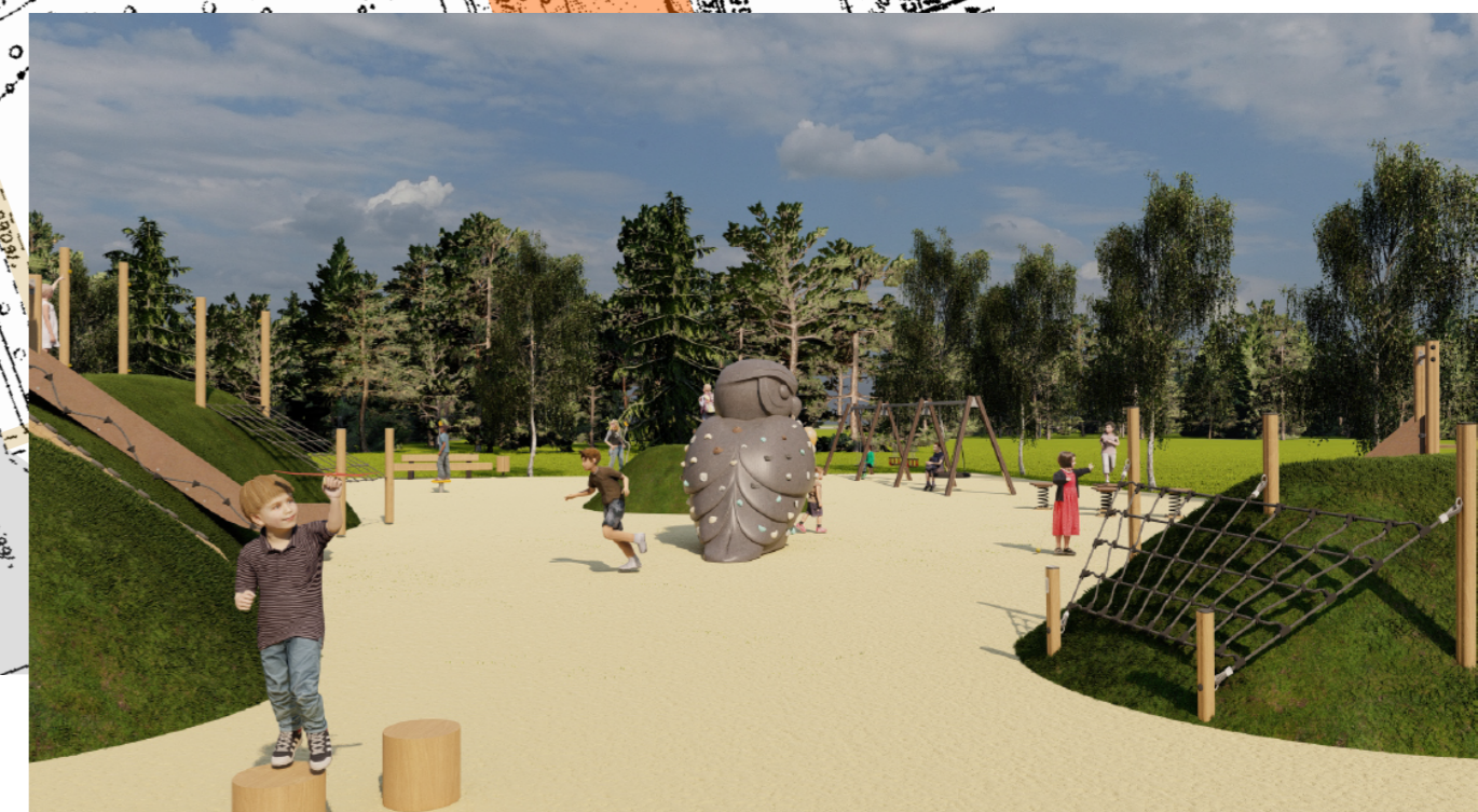
Детская тематическая игровая площадка "Природа Урала" с элементами геопластики