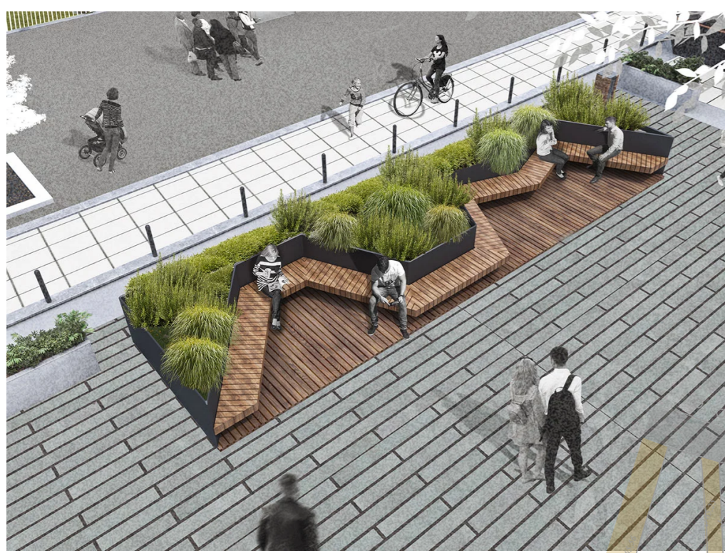
Парклет рядом с Общежитием