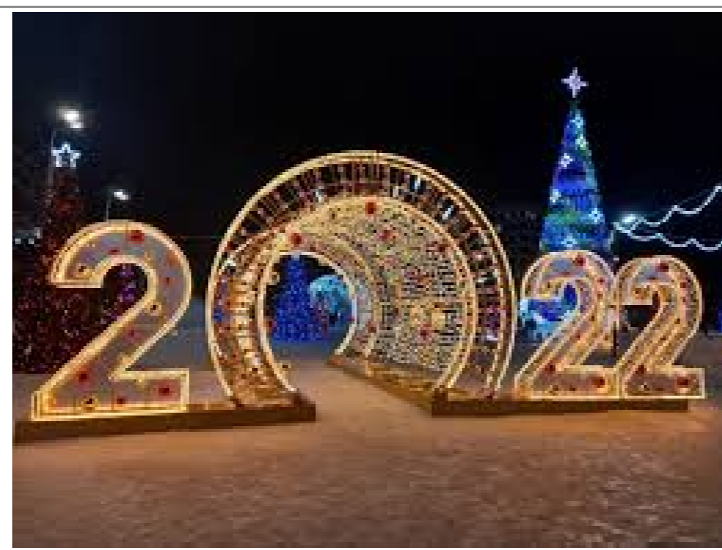
Площадка для новогодней елки с иллюминацией