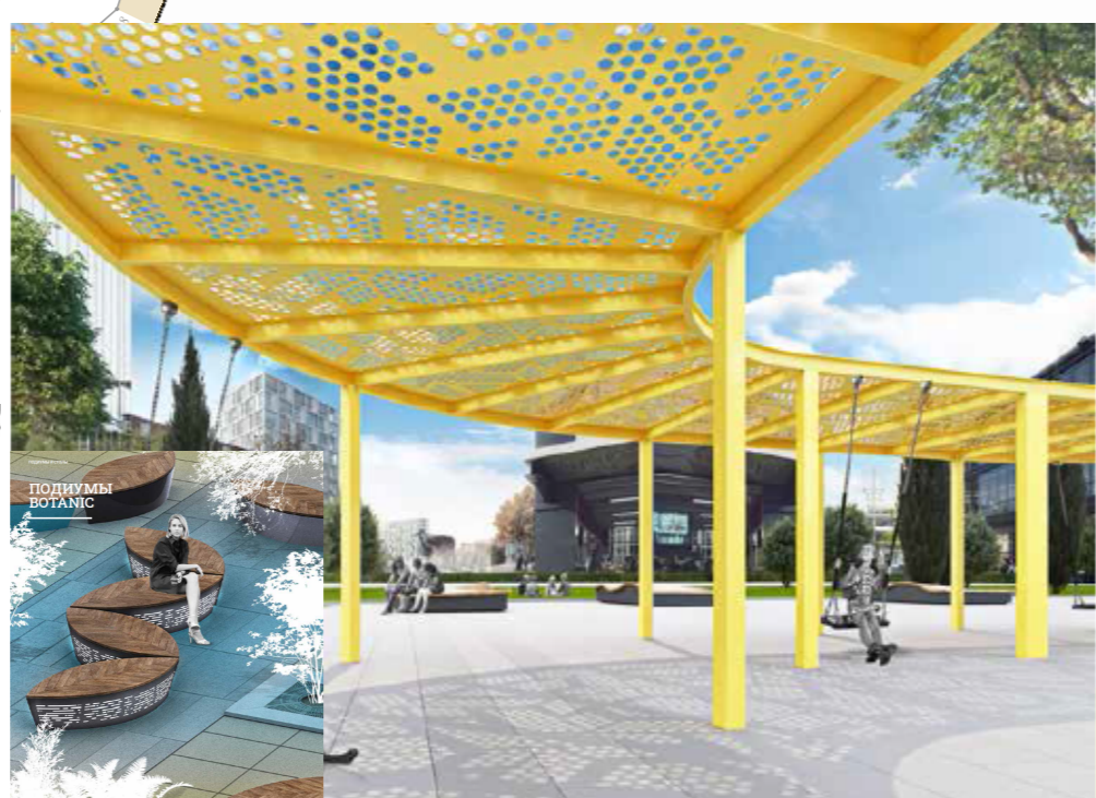
Пергола со скамьями (подиумами) для Щипачевских чтений