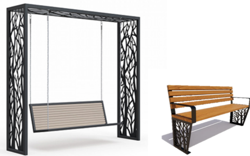
Качели и скамейки с элементами индивидуальными - рисунками лазерной резки