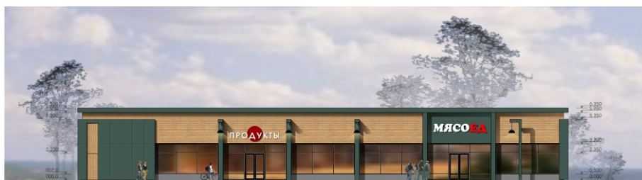
Магазин продовольственных товаров