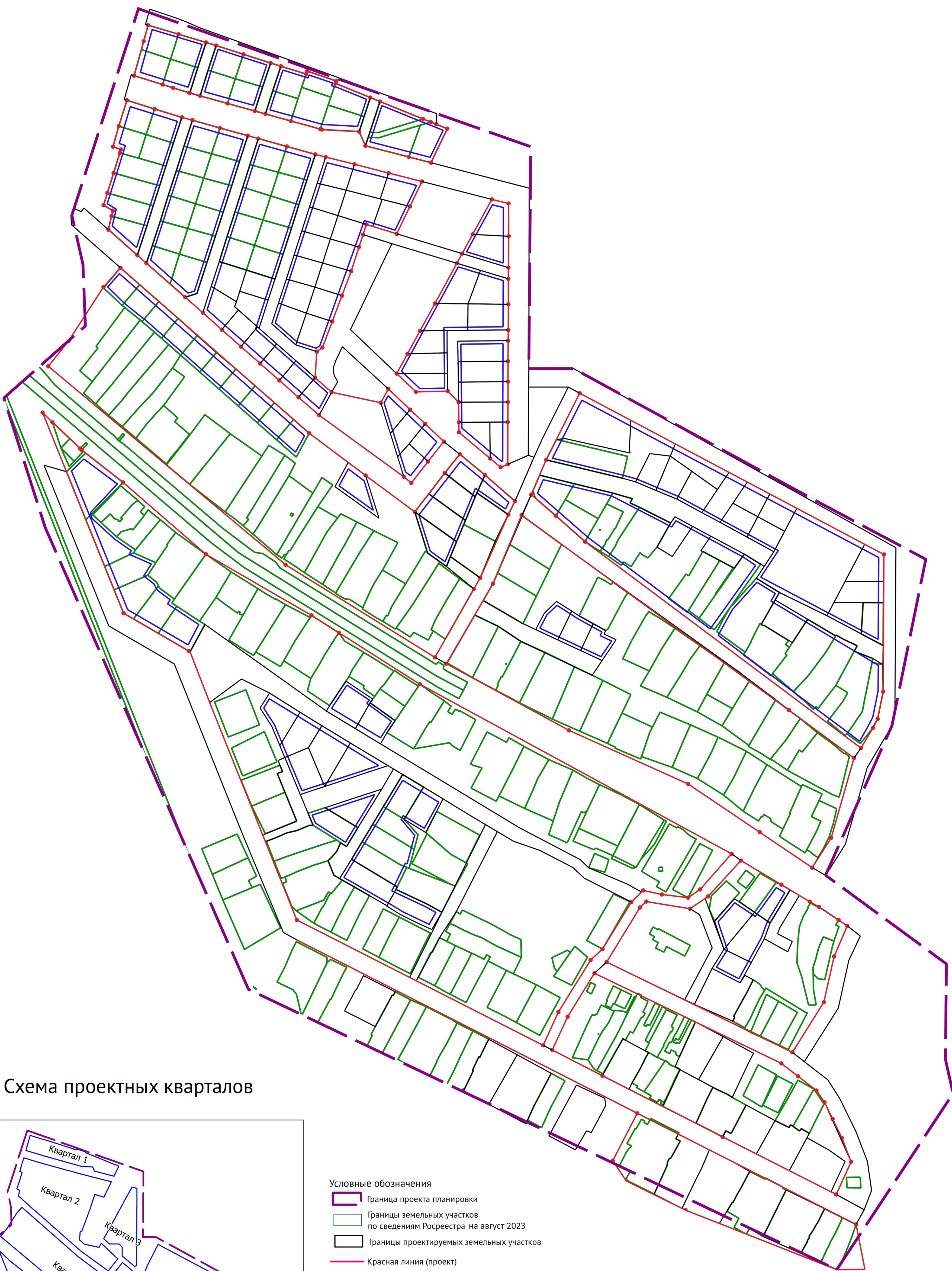
Схема проектных кварталов