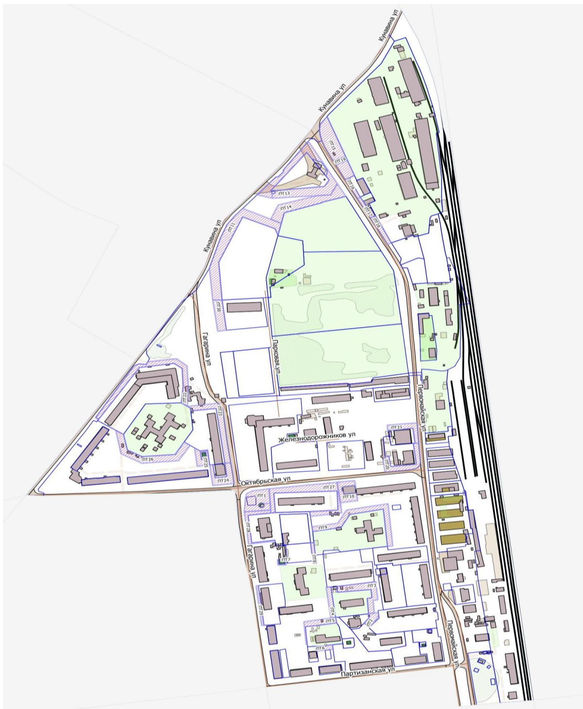
Схема 6. Раздел 1.

План (чертеж, схема) прилегающих территорий