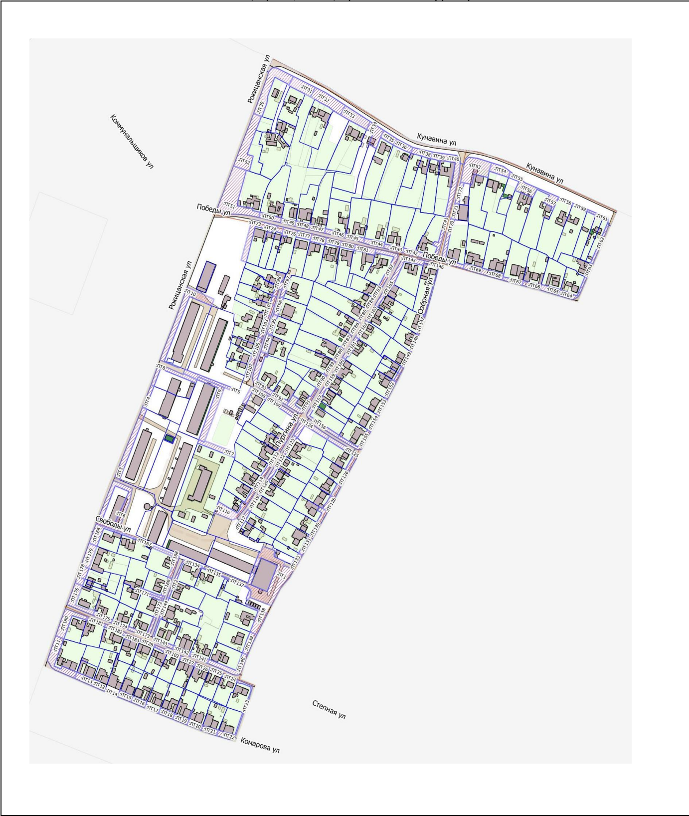
План (чертеж, схема) прилегающих территорий