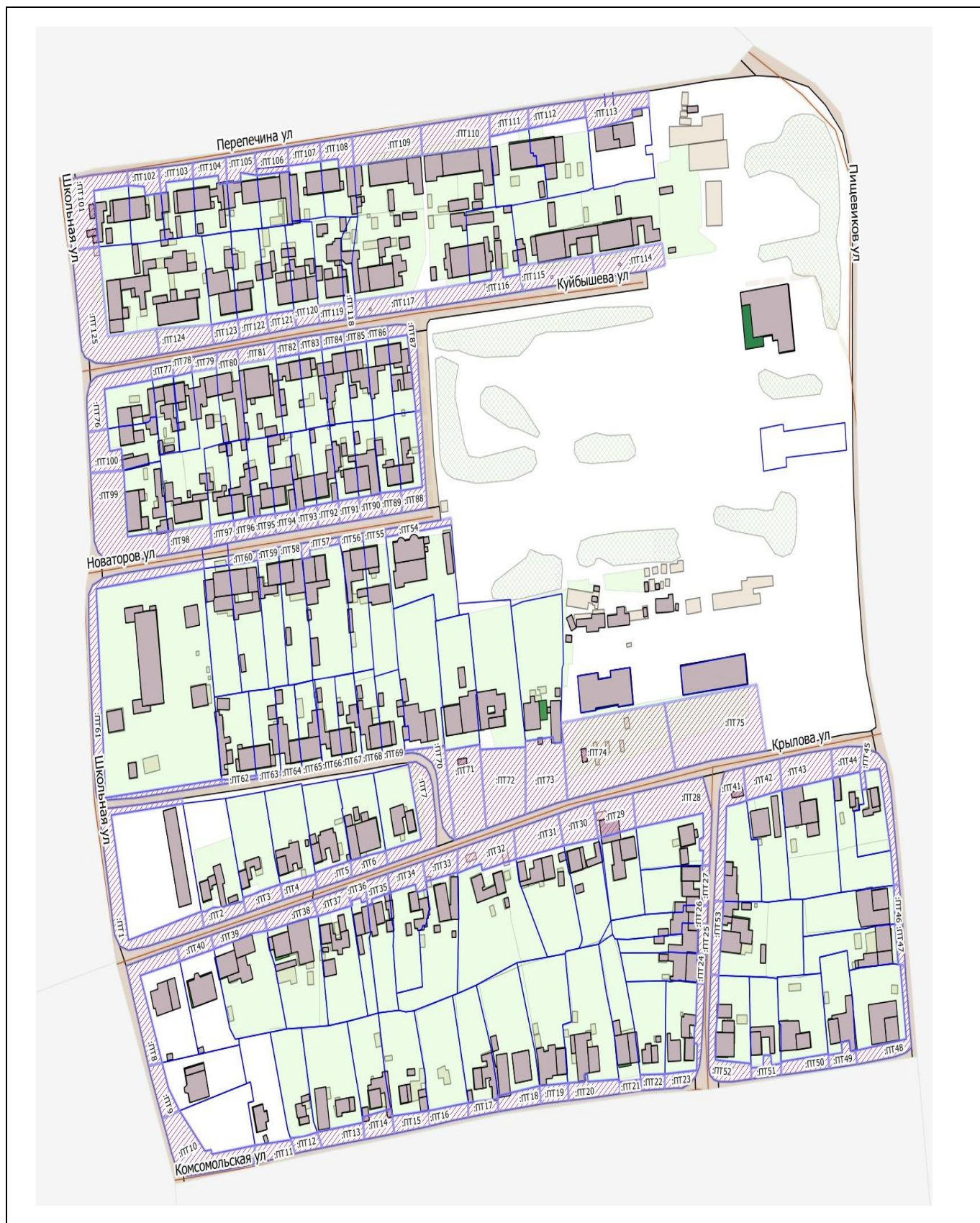
Схема 3. Раздел 1.