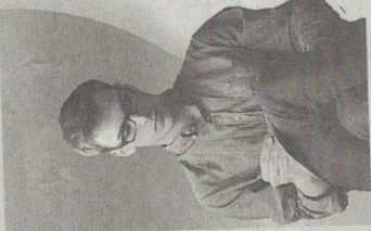
ШКОЛА «СОЦИАЛЬНОГО ПРЕДПРИНИМАТЕЛЬСТВА»